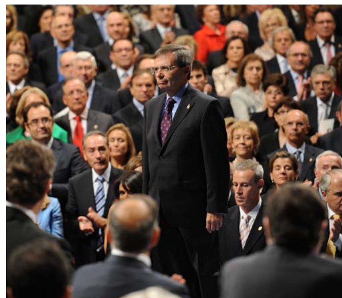
Ceremonia de entrega de los Príncipes de Asturias 2010