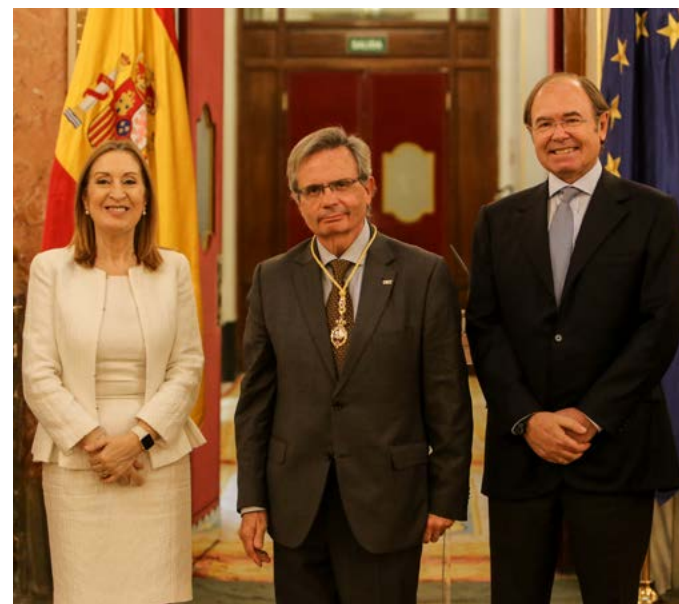
Matesanz, entre Ana Pastor, presidenta de la Cámara Baja, y Pio García Escudero, presidente del Senado, con la Medalla del Congreso de los Diputados en el 40 aniversario de la Constitución

a la cabeza del mundo y que sigamos ahí 27 años después ha sido lo que realmente hizo que se estableciera un acuerdo global para apoyarlo y alejarlo de las confrontaciones políticas. Los trasplantes, más o menos, han sido respetados por los partidos políticos cuando han visto que era una estructura tan sólida que meterse con ella o contra ella podía dejarles tocados.