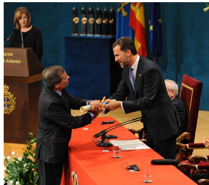
Ceremonia de entrega de los Príncipes de Asturias 2010

Aquello cambió absolutamente mi forma de ver la