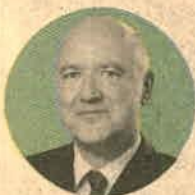
MALCOLM WOODFIELD VP global de educación superior para SAP.

cambiando las formas en que los trabajadores pueden operar, mejorando sus condiciones de trabajo, debido a la implementación de soluciones tecnológicas como todas las aplicaciones en la nube que se han vuelto relevantes. Las próximas generaciones estarán